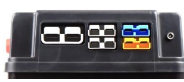
1 x 175A - 4 x 50A