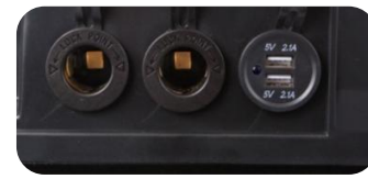
1 x USB double