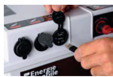
Sortie USB pour branchement téléphone, tablette, etc.