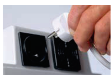
Prise 230 V /1000 W pour version avec convertisseur intégré