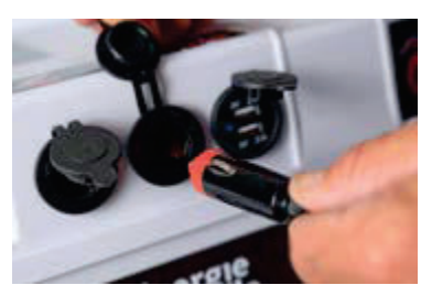
Allume-cigare pour branchement consommateur DC 12 V