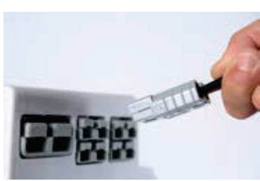
Prise 50 A pour branchement régulateur solaire, réfrigérateur, etc.