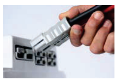
Prise 175 A pour branchement convertisseur DC/AC jusque 2000W.