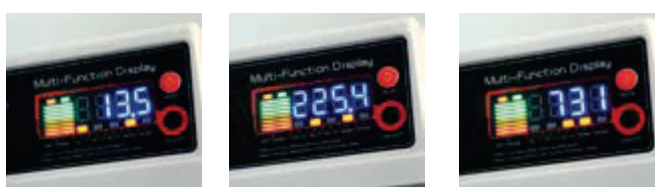
Affichage tension batterie Affichage tension sortie Affichage puissance