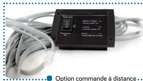
■ Option commande à distance

Les CS+DIF sont également dotés de nombreuses fonctions indispensables au bon fonctionnement de votre système : Mode Veille, Courant de charge ajustable, Tension de coupure batterie et plage d'entrée 230 V réglable.